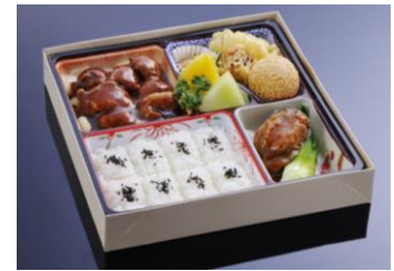
≈≈ 雷鳴 ≈≈ ¥3,240

牛ミニステーキ黒胡椒炒め、京湯葉春巻き、イカの天ぷら、殻付き鮑の醤油煮込み、ご飯、ザーサイ、胡麻団子、フルーツ