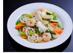
海の幸三種塩味炒め ¥2,040