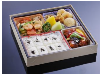
≈≈ 雲海 ≈≈ ¥1,620