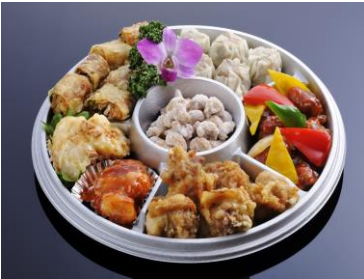
中華オードブル大(4~5名様) ¥5,400