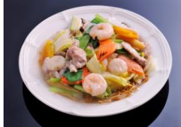
あんかけ焼きそば ¥1,400