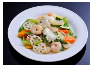
海の幸三種塩味炒め ¥2,040