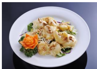
海老のマヨネーズ和え 牛肉のオイスターソース炒め ¥1,560