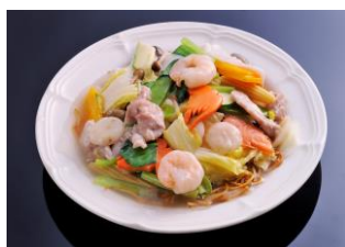
あんかけ焼きそば ¥1,400